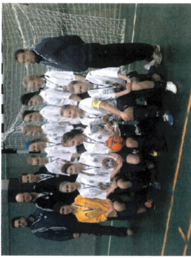
Kuvassa Futsalin Suomenmestarijoukkue.

Kirkkaimpana saavutuksena keväältä on B tyttöjen sarjassa FC Hapo/EuPa yhteisjoukkueella futsalin Suomen Mestaruus.